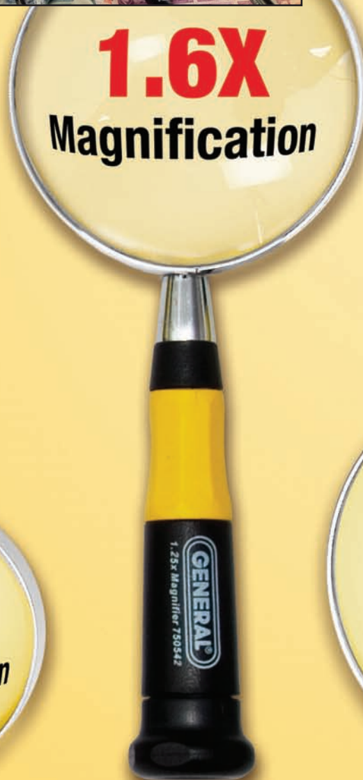
NO. 750542 3" (75mm) Magnifier