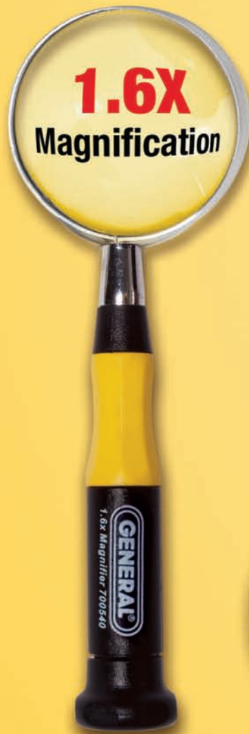
NO. 700540 2" (50mm) Magnifier