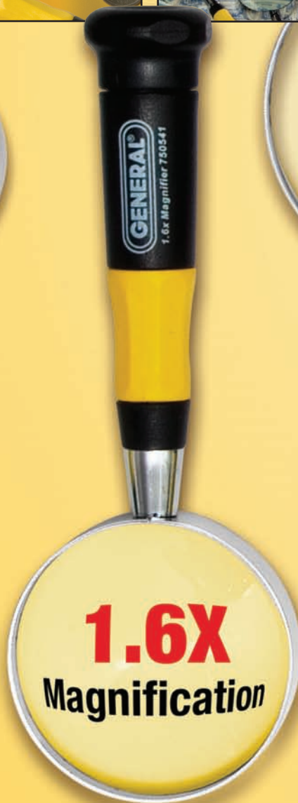
NO. 750541 2-1/2" (65mm) Magnifier